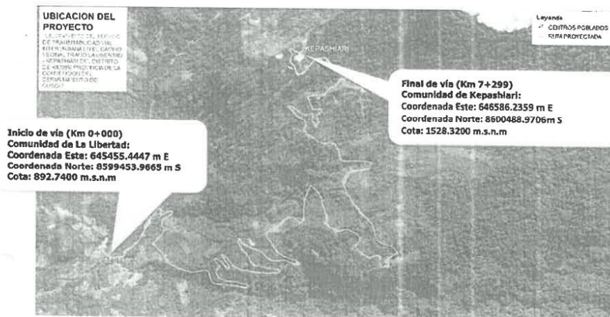
Imagen N° 01: Ubicación localidades beneficiarios en GOOGLE EARTH.

Se ubica en el Tramo Libertad y Kepashari, (Eje único y principal) las coordenadas de estos lugares son las siguientes: