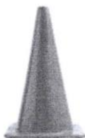
CONO DE SEGURIDAD