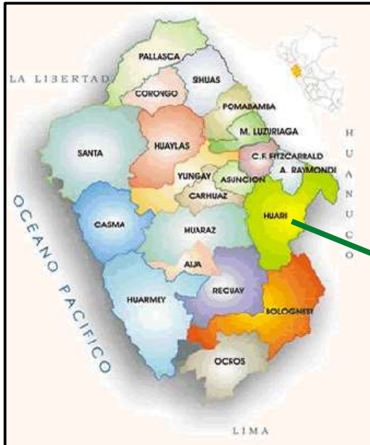
Departamento de Ancash