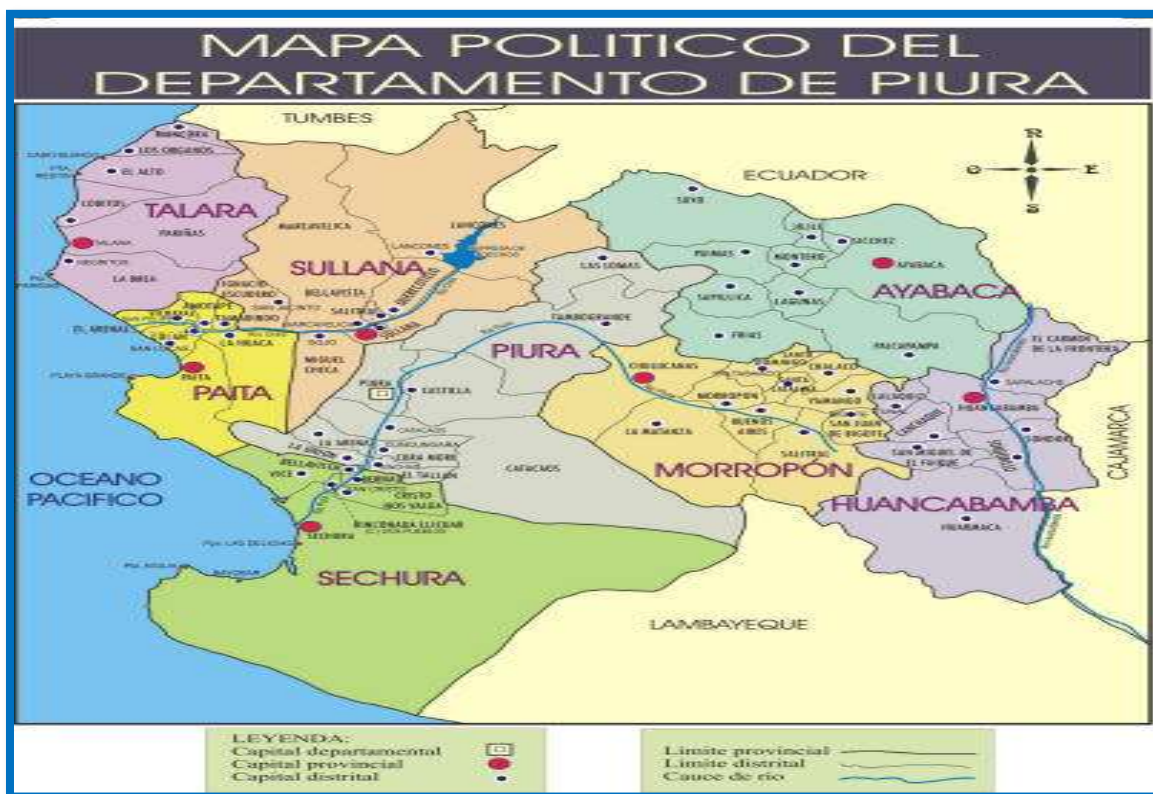
Grafica N.º 01. Ubicación Geográfica del Proyecto