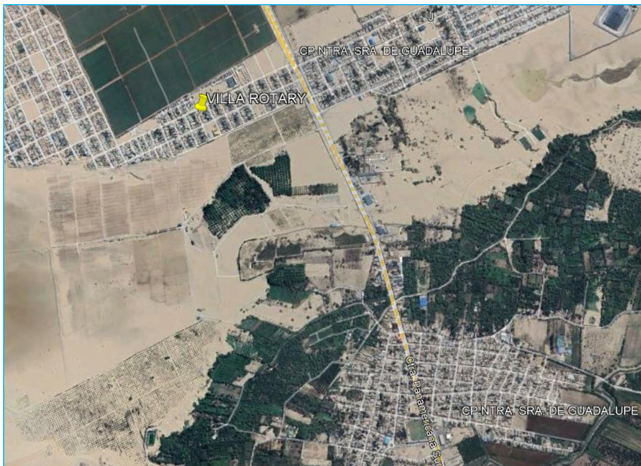
GRAFICO N° 02: VISTA SATELITAL DE LA LOCALIDAD BENEFICIARIA (VILLA ROTARY)