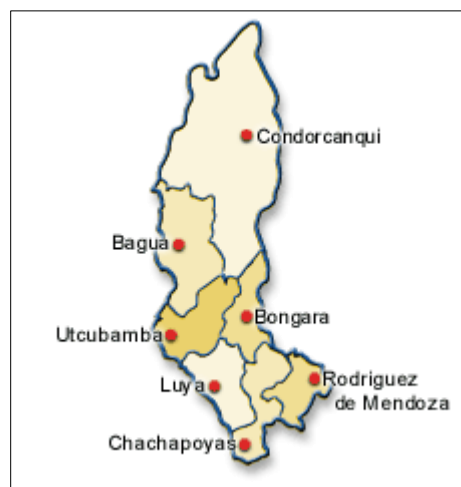
Ilustración 2: Mapa del departamento de Amazonas