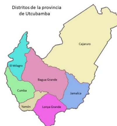
Ilustración 4: Mapa del Centro Poblado Ñunya Jalca