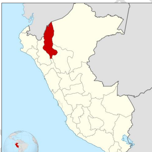
Ilustración 1: Mapa macro de la localización del Perú