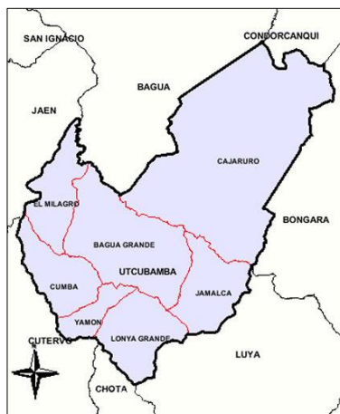
Ilustración 3: Mapa de la Provincia de Utcubamba