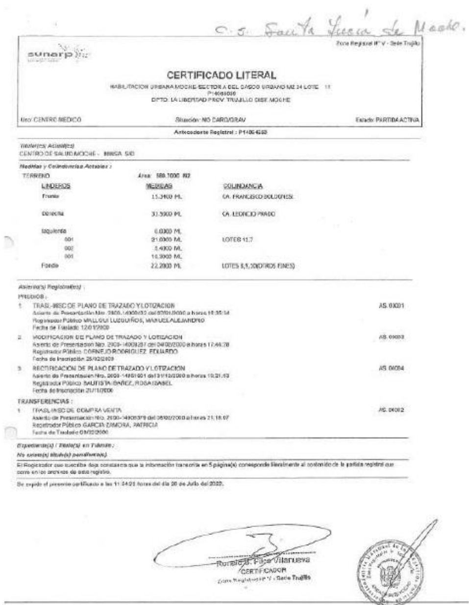
Imagen 01: Partida Registral del Centro de Salud Santa Lucia Moche