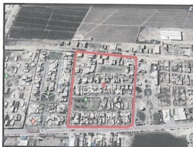
Imagen N°01: Ubicación del Proyecto

"Cuna y Capital del Arte Negro Nacional" "Cañete Valle Bendito y Productivo"