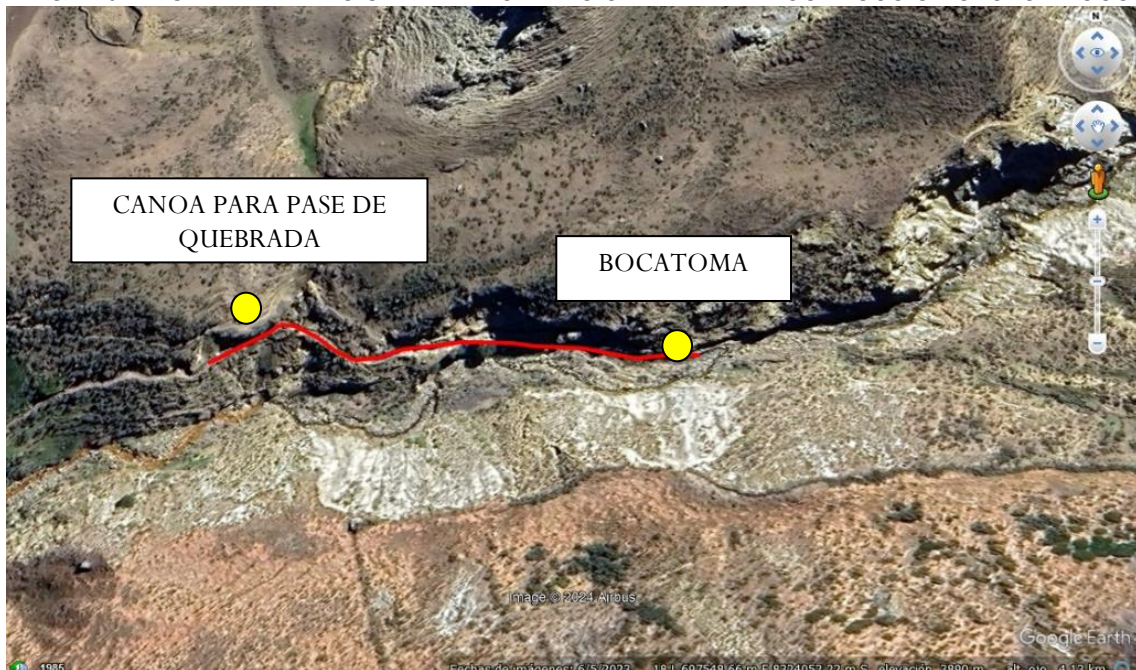
IMAGEN 02. VISTA DEL TRAZO SATELITAL CAPTACION Y LINEA DE CONDUCCION SECTOR TOCCA