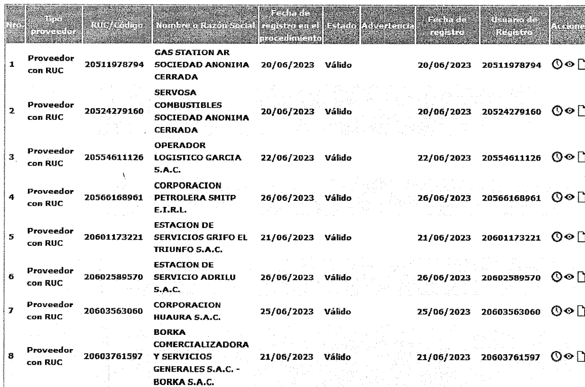
Cuadro N° 01 Detalle de los participantes validos que se registraron

En el presente acto, el OEC deja constancia que de la revisión de la plataforma SEACE, se advierte la existencia de ocho (08) participantes registrados en el SEACE, conforme al siguiente detalle: