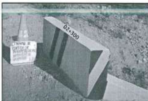
Imagen referencial N°03

Se pintará el parapeto de alcantarilla y aleros, según la imagen referencial.