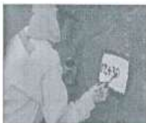
Imagen referencial N°01

Se pintará las progresivas de fondo color blanco, letras color negro, y escritura de la siguiente manera por ejemplo 02+300.