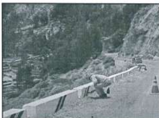
Imagen referencial N°04

Fondo blanco y líneas de color negro y amarillo, y progresiva de ubicación.