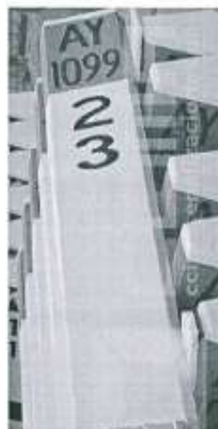
Imagen referencial N°02

Se pintará las progresivas de fondo color blanco, letras color negro, y escritura de la siguiente manera por ejemplo 02+300.