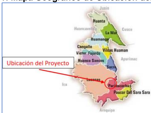
Figura II-1: Mapa Geográfico de Ubicación del Proyecto

El Proyecto se desarrollará en la zona centro del Perú, en el departamento de Ayacucho, provincia de Parinacochas y distrito de Coracora, a una altitud de 3200 msnm.