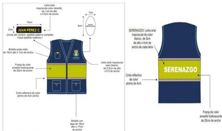
GRÁFICO N° 17 - POSTERIOR