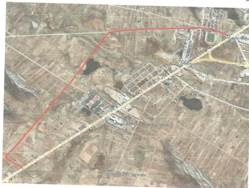
Figura 2: Zona del proyecto