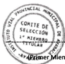
(Primer Miembro Titular)

Siendo las 12:48 horas del día 21.04.2025 se dio por concluida la presente sesión levantándose el acta correspondiente la misma que fue leída y aprobada sin observaciones, procediéndose a su suscripción por los miembros del comité de selección, en señal de conformidad.