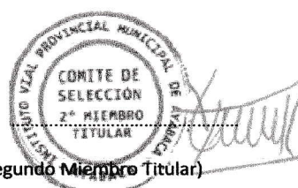
(Segundo Miembro Titular)