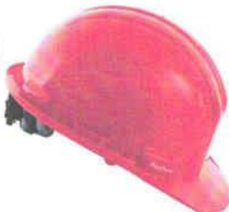
CASO DE SEGURIDAD