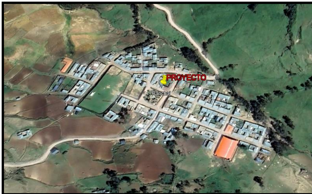
Imagen 2. Vista satelital del Centro Poblado de Ranchaj, distrito de San Nicolás – Provincia de Carlos Fermín Fitzcarrald – Departamento de Ancash.