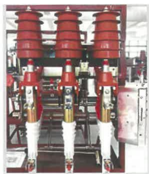
Figura N.º 1 Seccionador bajo carga con base porta fusible

La celda de protección será equipada con barras de cobre mínimamente de dimensiones 5x50mm según plano que permitirá la conexión entre la celda de remonte y la celda de protección en media tensión según lo mostrado en plano de detalle (Fig.1), a su vez esta celda permitirá la conexión de los cables de media tensión por la parte inferior con el transformador.