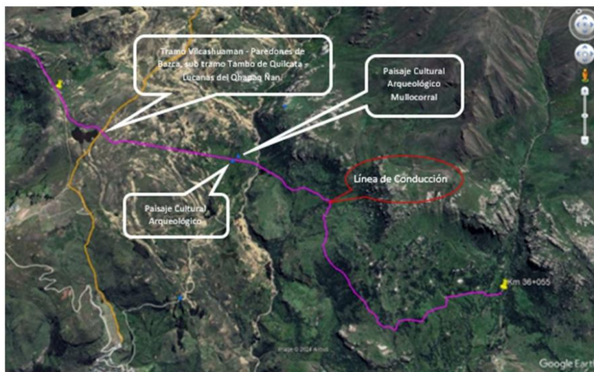
Gráfico N°03: Vista satelital del tramo de la línea de conducción en superposición con el Tramo Vilcashuamán – Paredones de Nazca, sub tramo Tambo de Quilcata – Lucanas