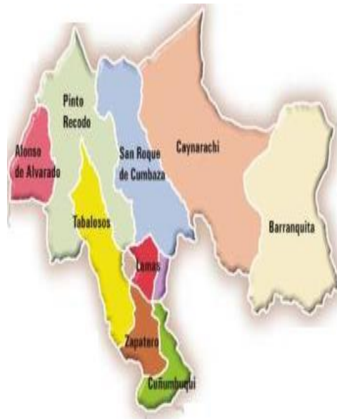
Mapa de la provincia Lamas