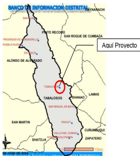
Mapa del Distrito Tabalosos