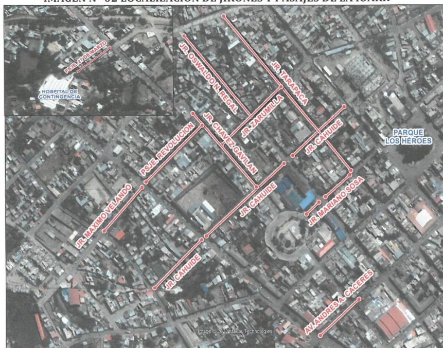
IMAGEN N° 02 LOCALIZACIÓN DE JIRONES Y PASAJES DE LA IOARR