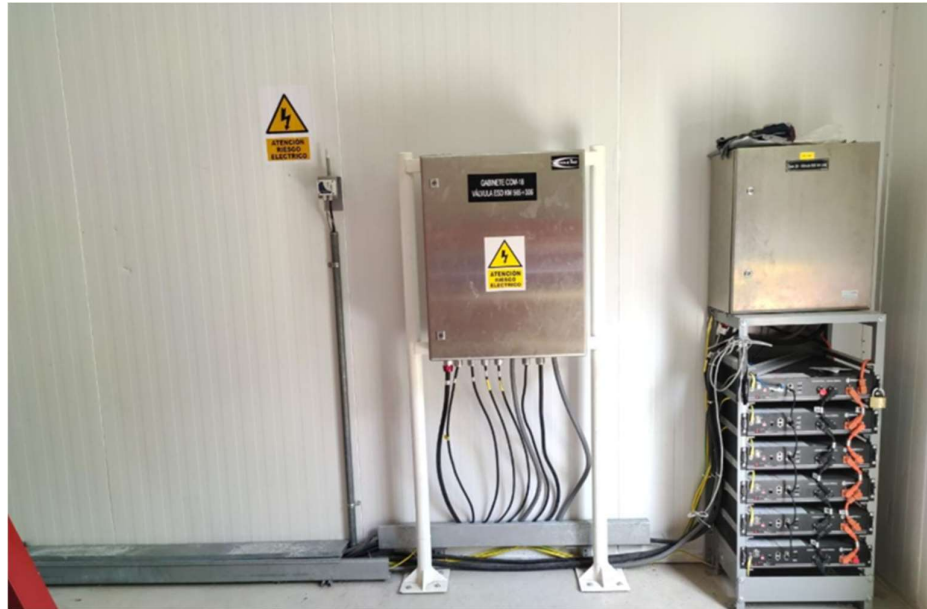
Fig. 1.- Interior de caseta de instrumentación

Los equipos (antena y reflector, HPA, modem, router y accesorios), correspondiente a los enlaces del Tramo I deben instalarse a una altura necesaria sobre el nivel del suelo para mantener claridad de la línea de vista y también evitar el contacto con el agua durante las temporadas de lluvias.