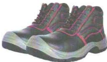
ZAPATOS DE SEGURIDAD TRABAJO – SEGURIDAD