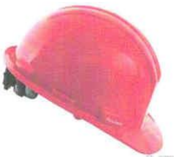
CASO DE SEGURIDAD