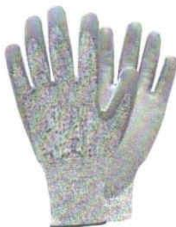
GUANTES DE TRABAJO