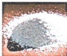
HIPOCLORITO DE CALCIO GRANULADO