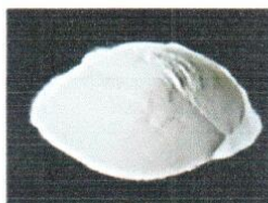
SULFATO DE ALUMINIO