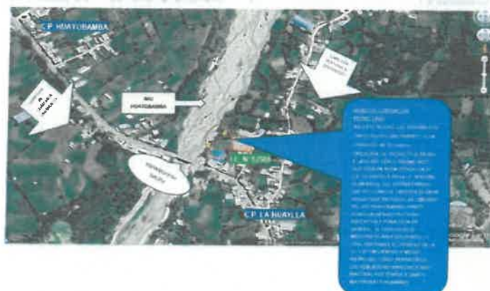
Figura 2: Macro localización Distrito de Pedro Gálvez

Resolución de Gerencia Municipal N° 096-2024-MPSM/GM