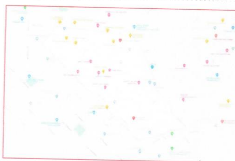
IMAGEN N°2 – UBICACIÓN DEL PROYECTO – GOOGLE