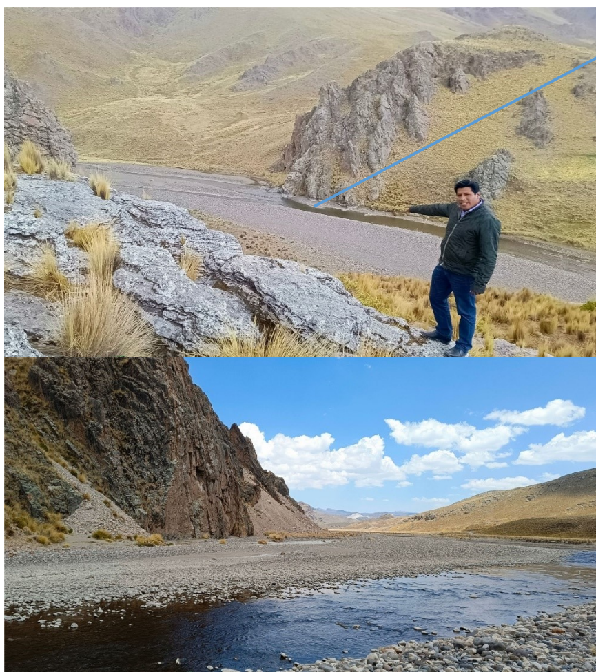
FUENTE DE AGUA

El punto de captación de la fuente de agua es la cuenca y sub cuencas del rio llave, a partir de ahí se deriva sus aguas a través de la infraestructura de conducción precaria.