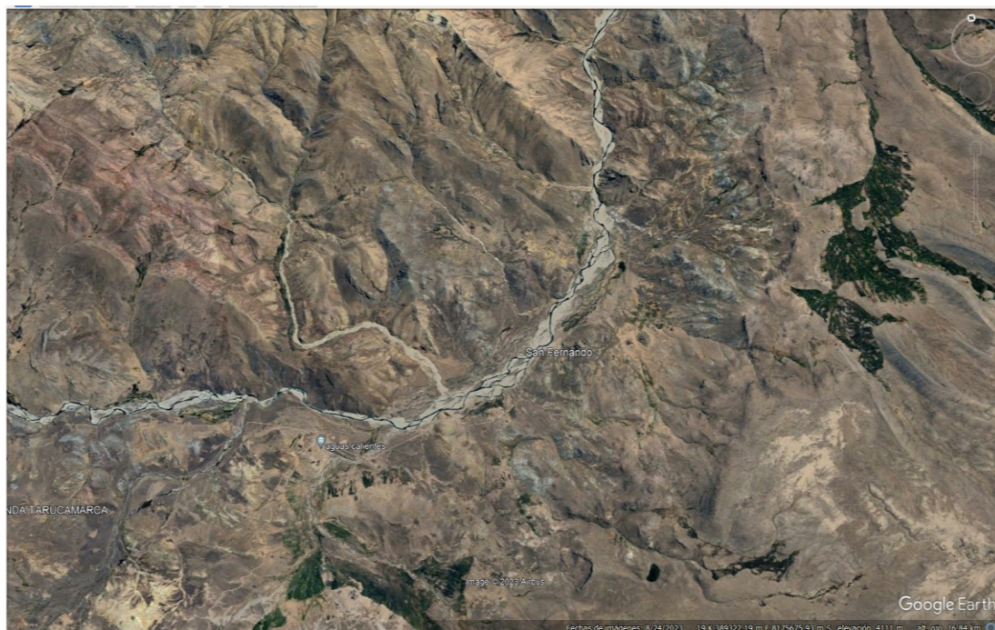
Croquis de ubicación del proyecto