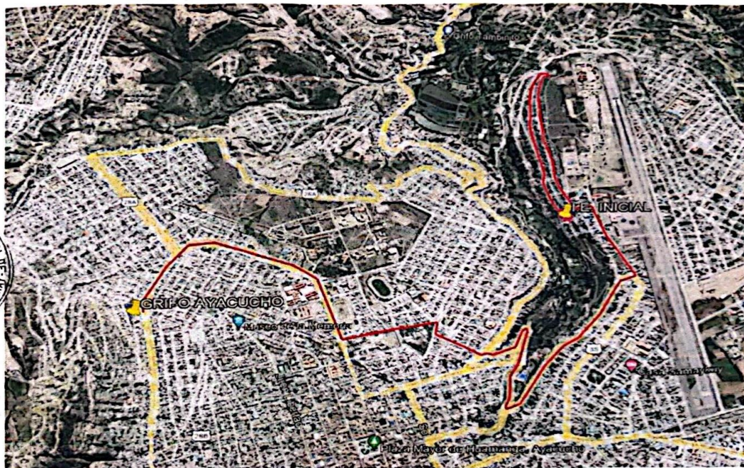
FIGURA N°02. ACCESO A LA I.E. 432-97 INICIAL VISTA HERMOZA