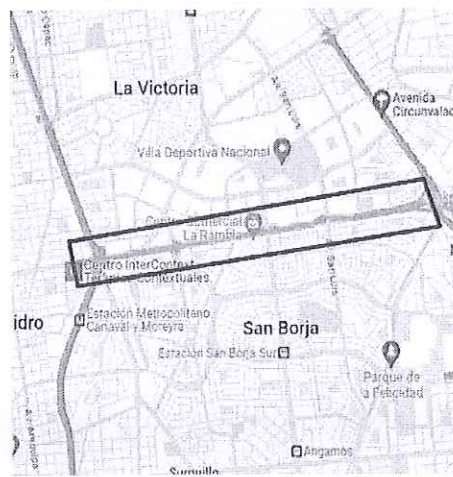
Figura 1: Coordenadas: 277289.85 m E; 8668577.94 m S; Z 18L