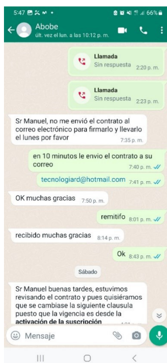
Coordinación con el representante legal de la empresa para enviar el Contrato N° 001-2024-MINCETUR/SG/OGA

3.7. En ese sentido, de acuerdo al correlativo de contratos de la entidad, derivados de procedimientos de selección en el marco de la Ley de Contrataciones del Estado, se procedió a elaborar el Contrato N° 001-2024-MINCETUR/SG/OGA, y de acuerdo a lo coordinado con el Adjudicatario, se procedió a remitir dicho contrato al correo electrónico tecnologiard@hotmail.com , correo otorgado por el propio Adjudicatario, a fin que gestione la firma de su representante legal, y que remita los ejemplares del Contrato; sin embargo, el representante legal de la empresa indicó que mandaría una carta dirigida a la Entidad el día lunes 8 de enero de 2024.