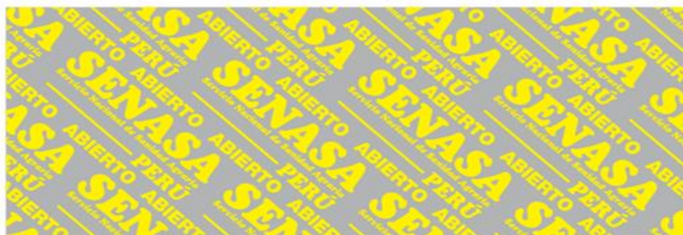
Masa Traslúcida Logo y texto amarillo (color apariencia) Gris indica Masa translúcida