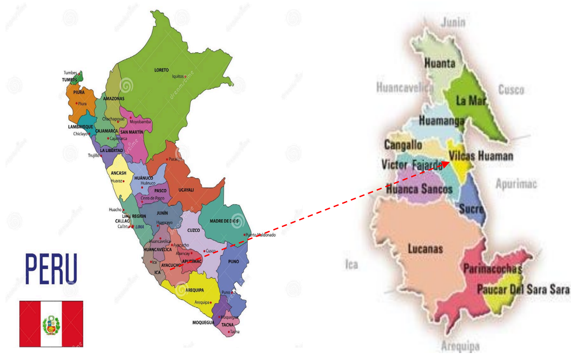
Figura N° 02: Ubicación Provincial.