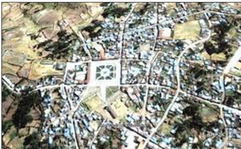
Figura N° 04: Ubicación del Área de estudio.