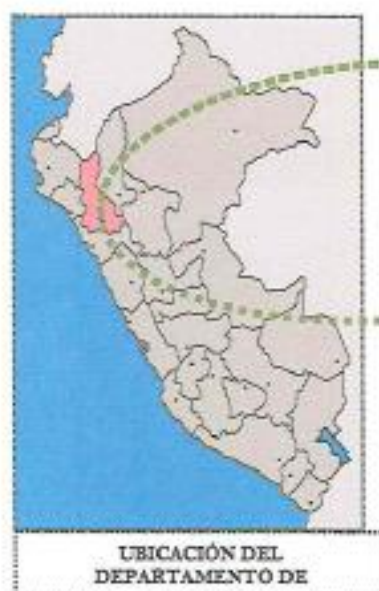
UBICACIÓN DEL DEPARTAMENTO DE