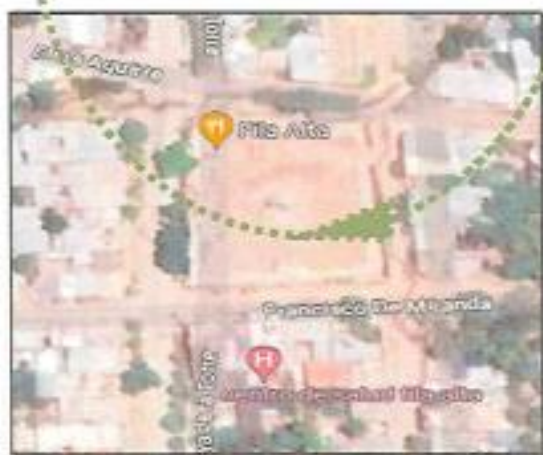
UBICACIÓN DEL PARQUE INFANTIL EN LA SEGUNDA ETAPA DEL SECTOR FILA ALTA, PROVINCIA DE JAÉN, DEPARTAMENTO DE CAJAMARCA