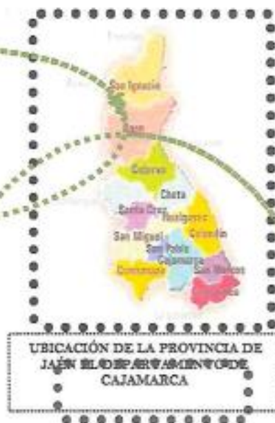
UBICACIÓN DE LA PROVINCIA DE JAÉN EN EL DEPARTAMENTO DE CAJAMARCA