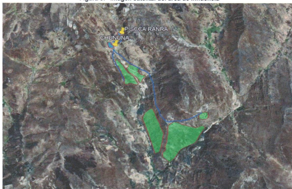
Figura 3: Imagen satelital del área de influencia

Familias beneficiadas : 40 familias aproximadamente. Área de riego : 50 hectáreas aproximadamente.