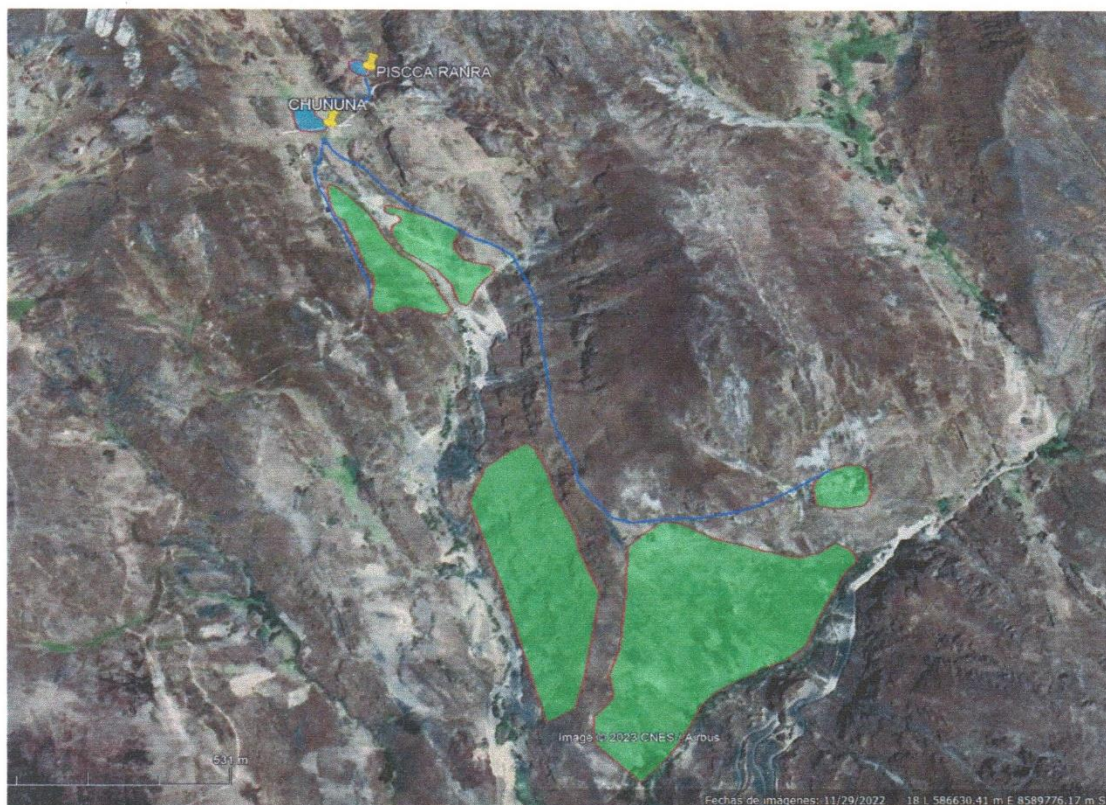
Figura 2: Mapa de ubicación y localización