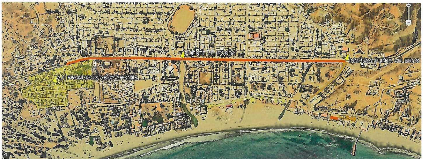
Ilustración 2. Ubicación del proyecto