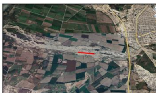
SECTOR FIGUEROA L = 692.00 ML