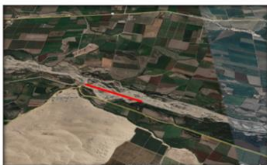
SECTOR MONTE FUERTE L=1327.92 ML