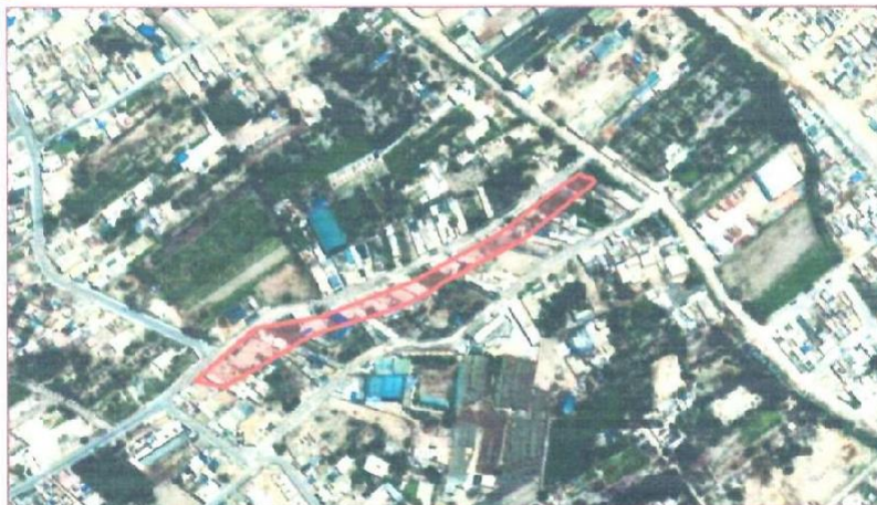
Zona Urbana – CALLE BAUTISTA

MUNICIPALIDAD DISTRITAL DE GROCIO PRADO SUB GERENCIA DE DESARROLLO URBANO