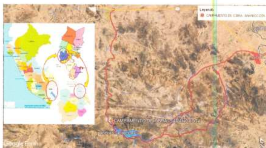
Accesos a la obra - Sapancota