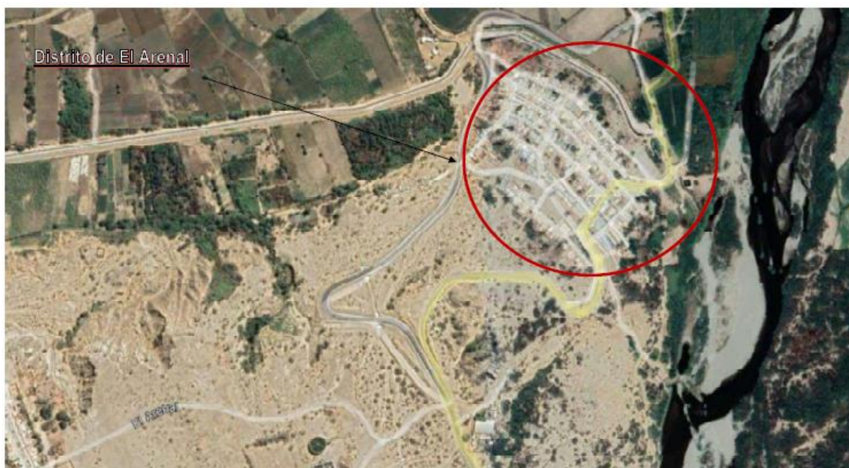
ESQUEMA N° 01. UBICACIÓN DEL ÁREA DE ESTUDIO DEL PROYECTO.