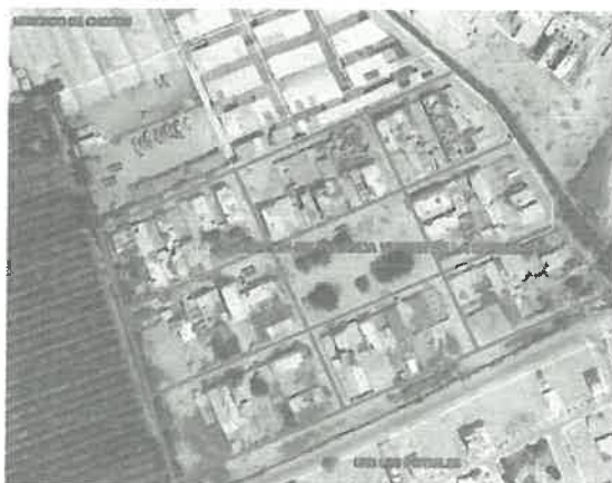
Imagen N°01: Ubicación del Proyecto

Departamento : Limia Provincia : Cañete Distrito : San Vicente Ubicación : Asociación De Vivienda Virgen De La Candelaria