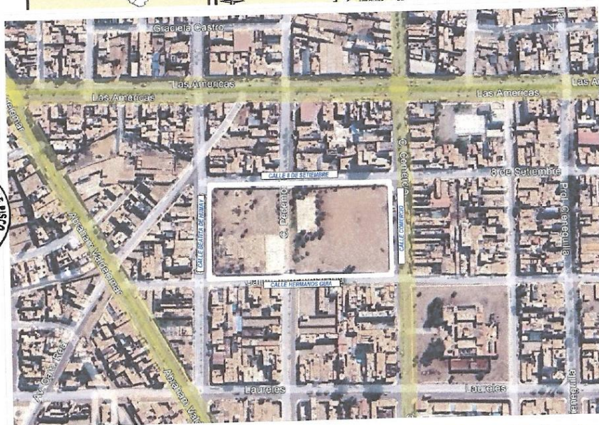
IMAGEN 2 Ubicación propuesta para el Coliseo Cerrado