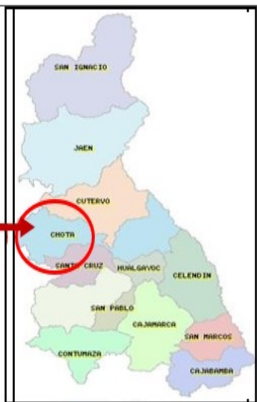
Figura 01: Ubicación Regional y Provincial