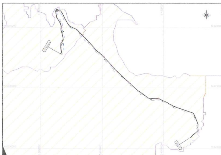
FIGURA 1.- Croquis de la Zona de trabajo (Obra: "MEJORAMIENTO DE LA INFRAESTRUCTURA VIAL TURISTICO TRAMO PHUTINI – JAYU JAYU, DISTRITO DE ACORA – PUNO – PUNO"