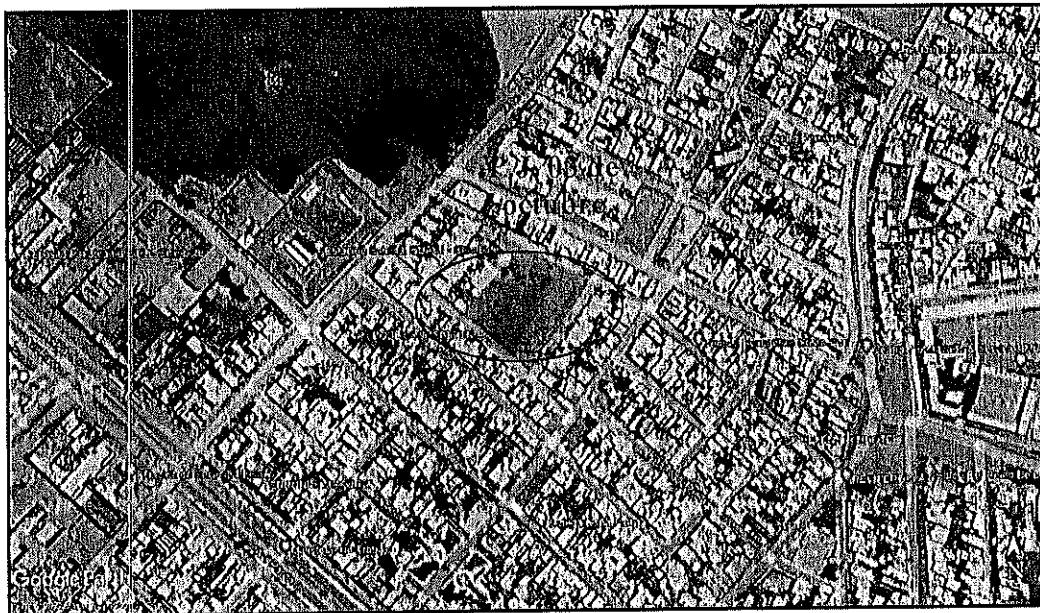
VISTA PANORÁMICA DEL AREA DE ESTUDIO