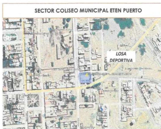
Imagen 2: Ubicación georreferencial de losa deportiva Municipal