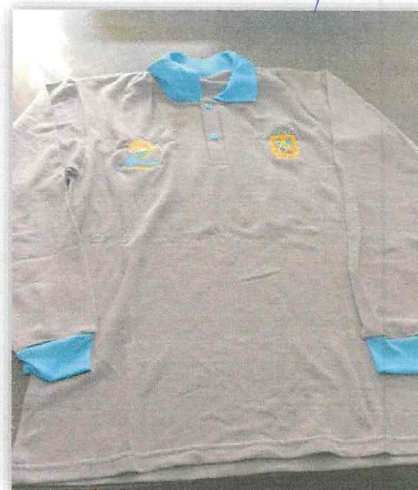
IMAGEN N°08: POLO