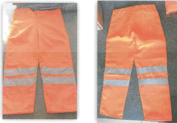
IMAGEN N°05 y 06 : PANTALON

S= 60; M= 150; L= 230; XL= 230; XXL= 92, XXXL= 70