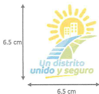
IMAGEN N°09: LOGO INSTITUCIONAL