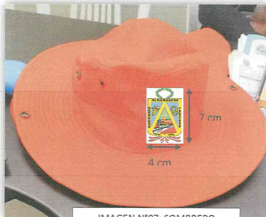
IMAGEN N°07: SOMBRERO