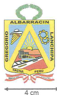
IMAGEN N°10: LOGO DEL ESCUDO DEL DISTRITO