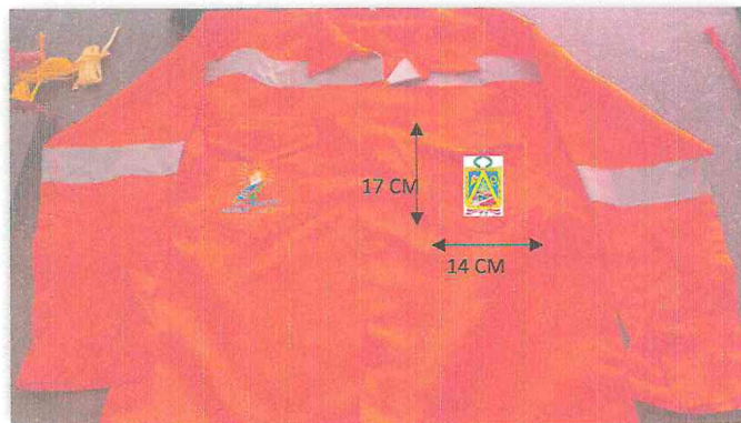
IMAGEN N°03: CAMISA (PARTE DELANTERA)