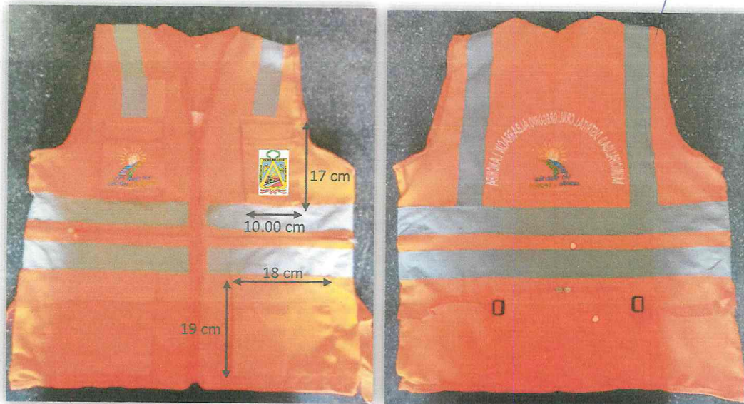
IMAGEN N°01 Y N°02: CHALECO