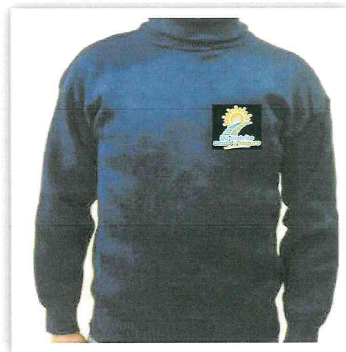
IMAGEN N°08: CHOMPA CUELLO ALTO TIPO JORGE CHAVEZ