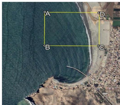
Figura 1. Área de levantamiento geofísico con Sub bottom profiler o tomografía eléctrica ó Ensayo SCPTU

Se debe realizar una campaña de investigación geofísica considerando la prospección geofísica usando la técnica con sub-bottom profiler o tomografía eléctrica ó ensayo SCPTU. Esta exploración deberá permitir conocer la morfología del fondo marino y el perfil estratigráfico de la zona donde se colocarán los pilotes de concreto o metálicos; consideradas en el proyecto. Asimismo, esta se calibrará en función de las muestras profundas obtenidas mediante Wash Boring y mediante la toma de muestras superficiales.