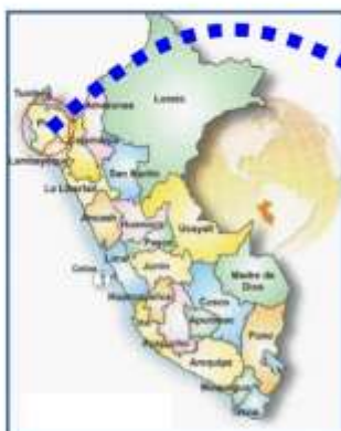
Gráfico N° 01: Mapa del Perú