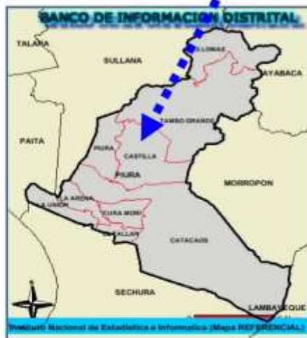
Gráfico N° 03: Micro localización