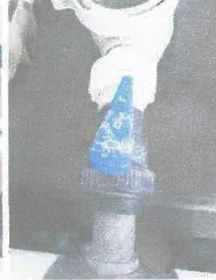
Imagen 03: Reparación de electrobomba 1HP de achique.