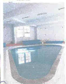
Imagen 13: Mantenimiento de instalaciones electromecánicas para piscina de niños.