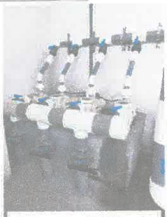
Imagen 01: Reparación de electrobombas de 3.5 HP PENTAIR y electrobomba inyectora de blue White.