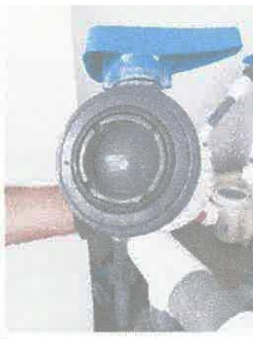
Imagen 02: Reparación de bomba motorizada, cambio de válvula esférica.