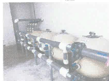
Imagen 12: Suministro de cuarzo para filtro de arena de 36".