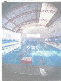
Imagen 14: Mantenimiento de instalaciones electromecánicas para piscina semiolímpica.

Av. Unión N° 316 web: www.munimiraflores-arequipa.gob.pe Miraflores - Arequipa - Perú