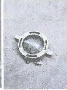
Imagen 04: Suministro de tapa para electrobomba.