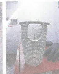
Imagen 07: Suministro e instalación de canastillas.