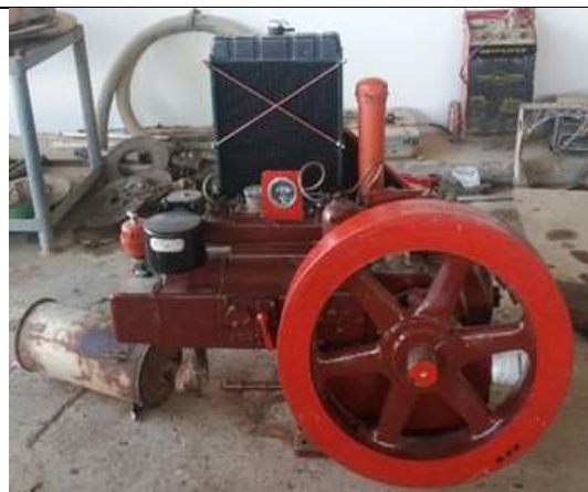
Motor a gas Arrow C-46