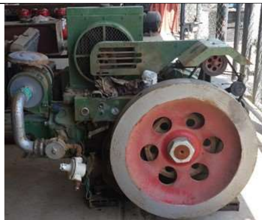
Motor a gas T1190N